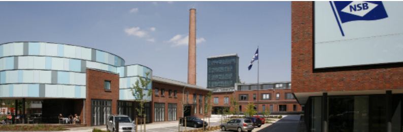
Außenansicht ckk academy auf dem Gelände der NSB Reederei