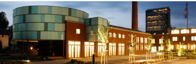
Nachtsicht ckk academy auf dem Gelände der NSB Reederei

ckk academy career certification consulting