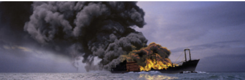
Krisenszenario ‚Brand‘