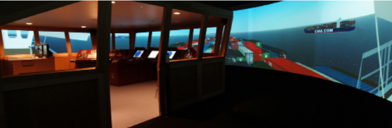
Die Brücke des Schiffsführungssimulators in Buxtehude